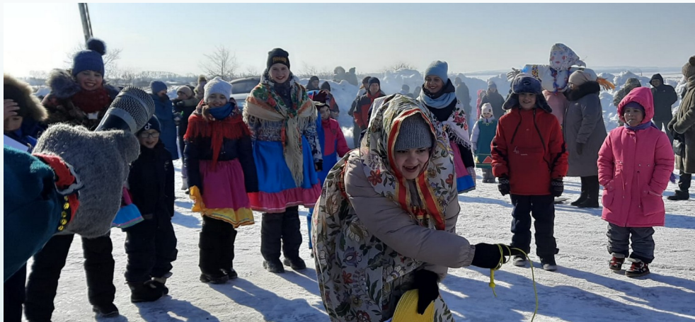
Фото «Широкая масленица»